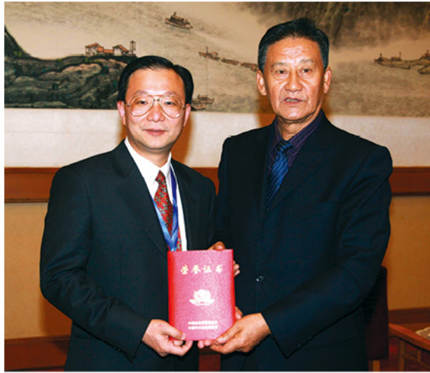
龚其恩先生与时任中共中央统战部田鹤年副部长